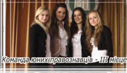
Команда юних правознавців - III місце