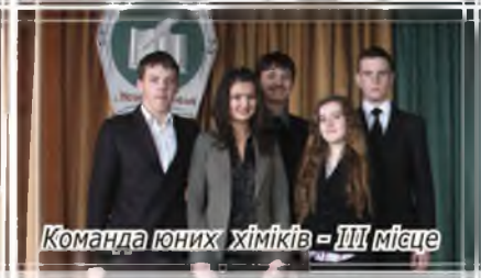
Команда юних хіміків - III місце