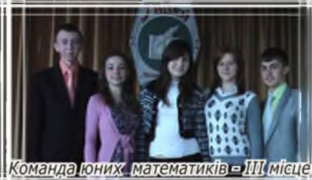
Команда юних математиків - III місце