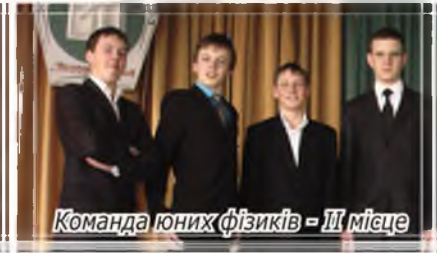
Команда юних фізиків - III місце