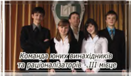
Команда юних винахідників та раціоналізаторів - III місце